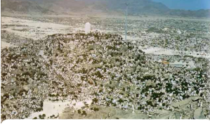
c) ARAFAT VAKFESİ