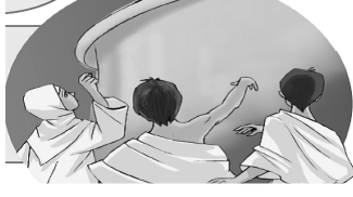
d) ŞEYTAN TAŞLAMAK

S-8 Müslümanlar için büyük öneme sahip Kabe'yi hangi peygamberler inşa etmiştir?